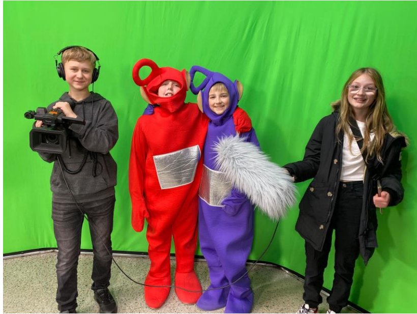
Foto fra filmkurs for ungdom i Hadsel