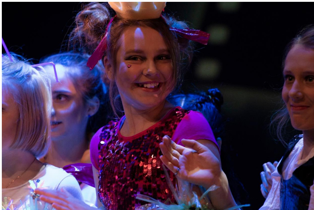
Dansere under Laterna Magicas filmfest