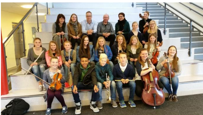
Foto: Elever og lærere på fordypningstilbudet

Våren 2016 ble det holdt avslutningskonsert i «Fordypningstilbud i musikk», hvor 16 deltakende ungdommer fremførte musikk både alene og i grupper. Det kom 52 voksne betalende på konserten, mens barn kom inn gratis. Arrangementet var en del av kulturuka på Sortland, og ble støttet av aksjonskomiteen for Kulturfabrikken. Høsten 2016 startet tredje runde med fordypningstilbud i musikk, og det kom rekordmange søkere. Det ble tatt opp 16 deltakere fra Andøy, Bø, Hadsel, Lødingen, Sortland og Øksnes, og før jul ble det arrangert to samlinger på Sortland.