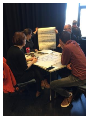
Foto fra Fagdagen