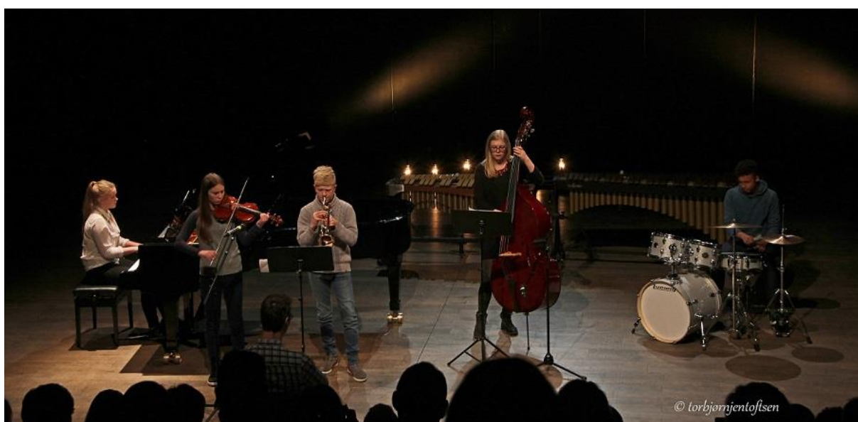
Fra avslutningskonsert i fordypningstilbud i musikk